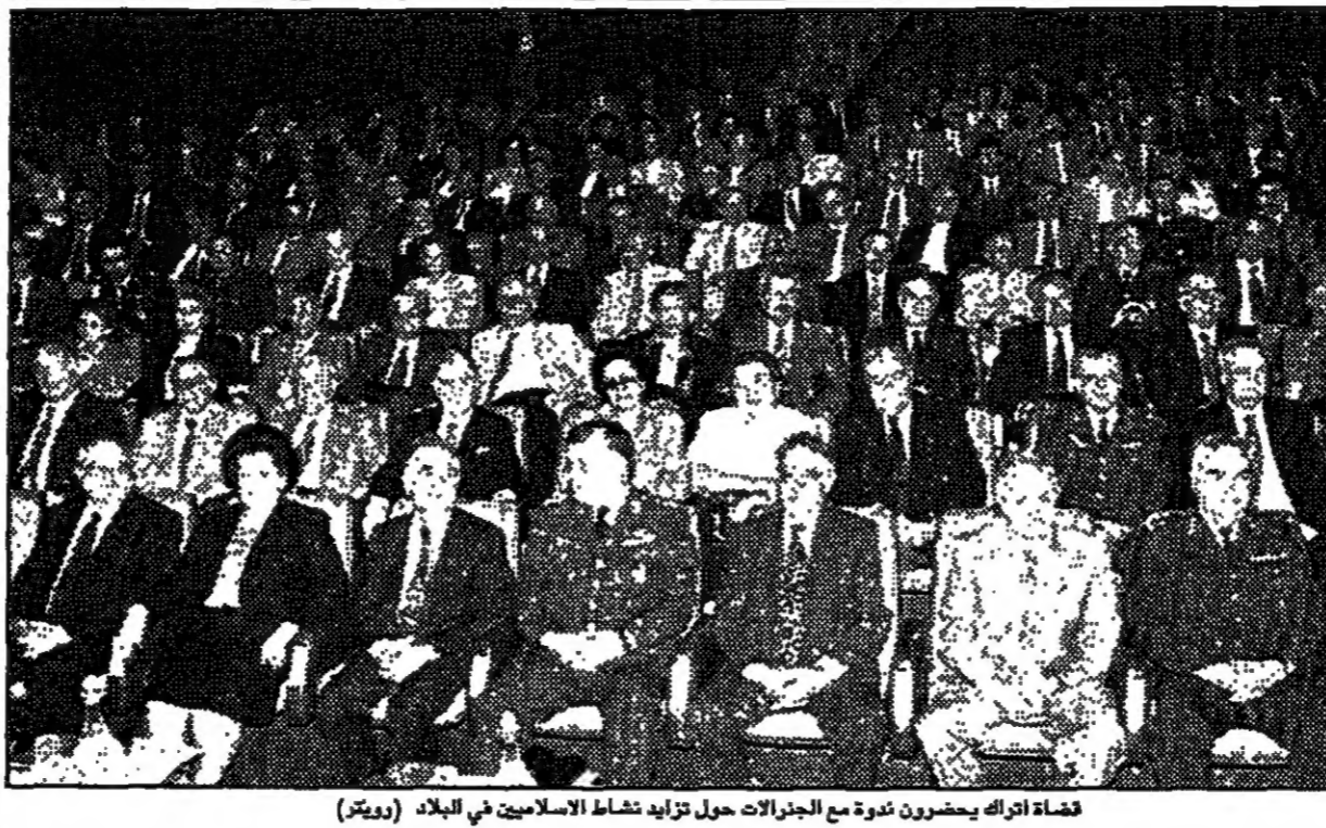
قاعة اتراك بحضور ندوة مع الجرائد حول تزايد نشاط الاسلاميين في البلاد